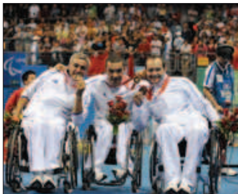
février 2009 : les médaillés d'or «tennis de table handisport» des Jeux Olympiques de Pékin 2008 à Raon l'Étape.