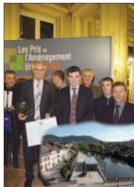
2009 : l'aménagement du quai de la Victoire est une réussite. C'est ce qu'à souligné Benoît Apparu, Secrétaire d'Etat chargé du Logement et de l'Urbanisme, ainsi que le groupe «Moniteur» qui a attribué à la Porte des Vosges le premier prix de l'aménagement urbain (catégorie des villes de - 10 000 habitants).