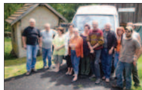
juin 2009 : première embauche chez Solid'action.