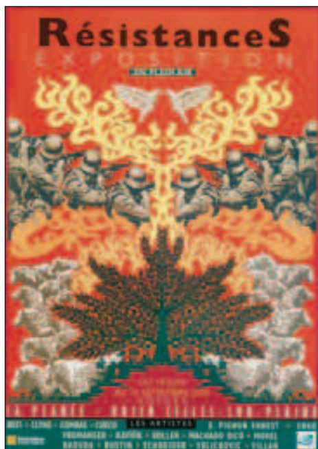
été 2009 : l'exposition «Résistances» organisée à La Planée a connu un beau succès.