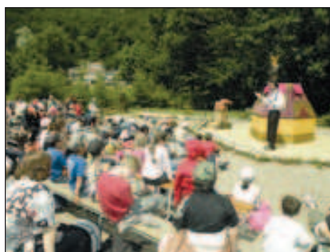
printemps 2009 : dans le cadre des 10 e Sylvianades, la forêt s'est invitée en ville pendant 3 mois.