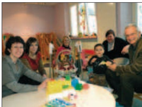
février 2009 : le multi-accueil «rêve d'enfance» est ouvert.