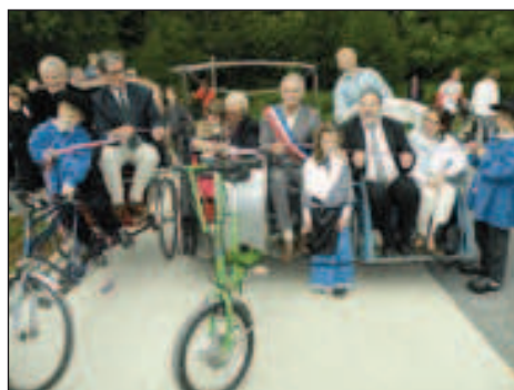
16 mai 2009 : une grande fête populaire organisée tout au long de la vallée de la Plaine a permis d'inaugurer en grande pompe la voie verte.