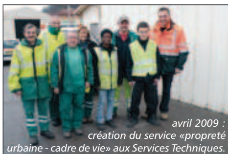
avril 2009 : création du service «propreté urbaine - cadre de vie» aux Services Techniques.