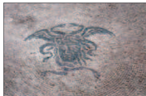
site archéologique de Suasa