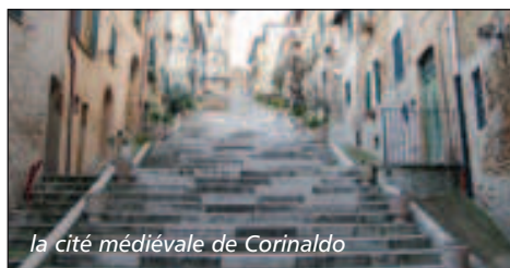
la cité médiévale de Corinaldo