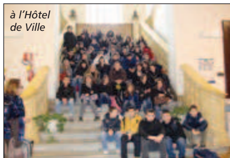
à l'Hôtel de Ville

le bus est resté coincé sur un carrefour d'autoroute à cause de la neige. Nous avons dû dormir dans un hôtel. Les adieux à nos familles d'accueil ont été très émouvants, mais de très bons souvenirs resteront dans nos mémoires.