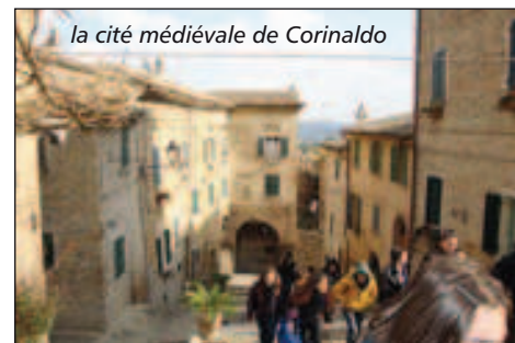
la cité médiévale de Corinaldo