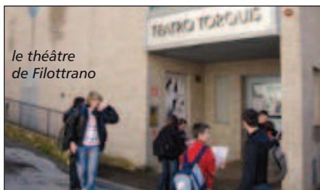
le théâtre de Filottrano