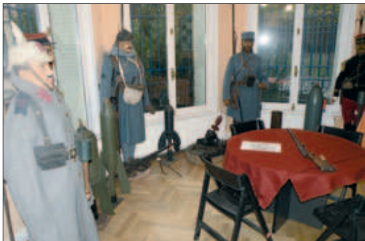
Des armes du centre d'interprétation de la Ménéelle (photo) seront présentées au stand de tir de la Criquelette le dimanche 19 septembre.